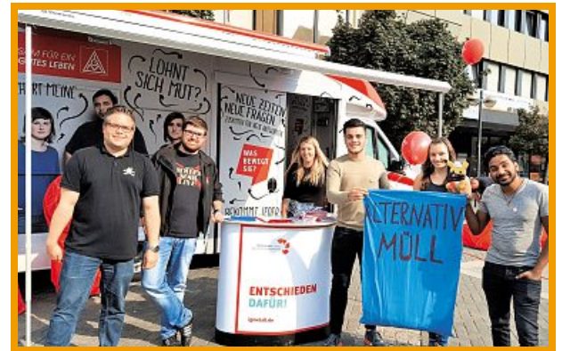
Die IG Metall-Roadshow in Neuwied

Die IG Metall Neuwied ist stark – durch Dich aber noch viel stärker! Wir zählen über 7000 Mitglieder, nun bist Du eine oder einer von uns. Jugendarbeit in der IG Metall hat eine lange Tradition. Politisches Interesse bedeutet nicht, einer bestimmten Partei anzugehören. Es bedeutet, sich für Dinge einzusetzen, von denen man überzeugt ist, für Werte einzustehen, die einem wichtig sind und gemeinsam mit anderen Themen voranzutreiben. Gleichzeitig gilt es Herausforderungen zu meistern und seine Talente einzubringen. Damit Du noch mehr von »uns« kennenlernen kannst, möchten wir Dir zwei besonders wichtige Punkte in der Jugendarbeit der IG Metall vorstellen. Und wer weiß – vielleicht hast Du danach auch Lust, bei uns mitzumachen?!